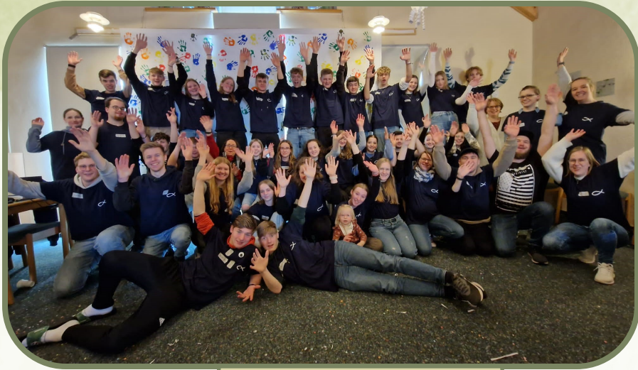
Das Mitarbeiterteam der KiBiWo